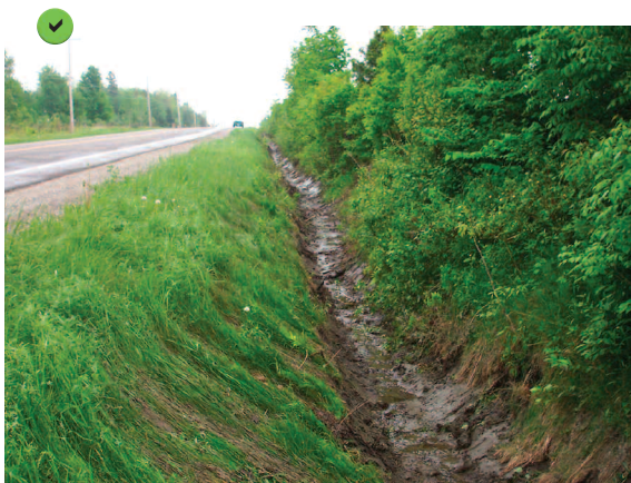
Fossé creusé selon la méthode du tiers inférieur.