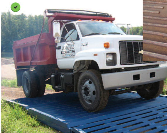
La longueur de la grille correspond à environ 10 fois le diamètre ou 3,5 fois la circonférence des roues. La forme ondulée écarte la gomme des pneus, ce qui fait tomber la boue et les cailloux incrustés.