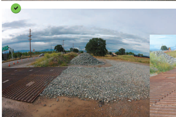
Fosse drainante et grille métallique ondulée.