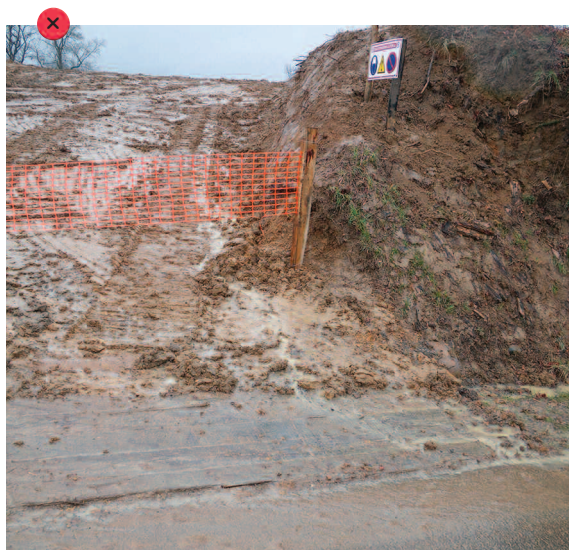
Accès au chantier non aménagé.