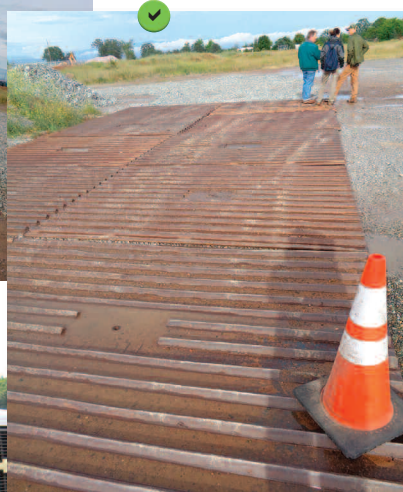
Grille métallique ondulée de protection des accès au chantier.